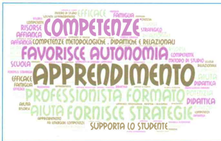
FIGURA 2 Termini inclusi nella definizione di tutor dell'apprendimento (la una maggiore grandezza della parola corrisponde una maggiore frequenza del termine riportato).

Il tutor aiuta e sostiene lo studente nel suo apprendere in modo autonomo e personale